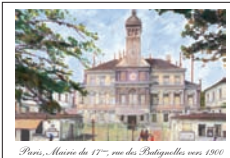
Paris, Avenue de la 17 e , rue des Postolles vers 1900