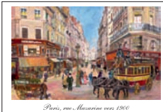
Paris, rue Rouvrez vers 1900