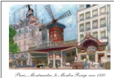
Paris, Montmartre, le Moulin Rouge vers 1900