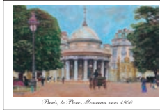
Paris, la Place Rouvrez vers 1900