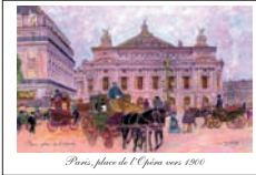
Paris, place de l'Opéra vers 1900