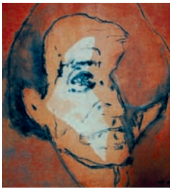
Antonin ARTAUD par GRAVLEUR