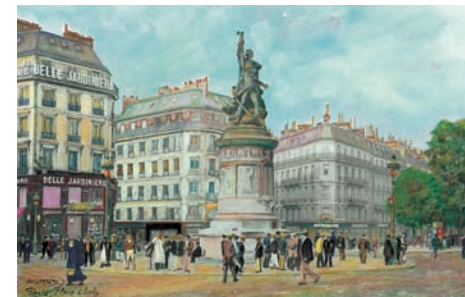
Place Clichy vers 1900 par Cacio BERÉNY

Du lundi au vendredi de 10 h 30 à 19 h. Le samedi de 11 h à 19 h