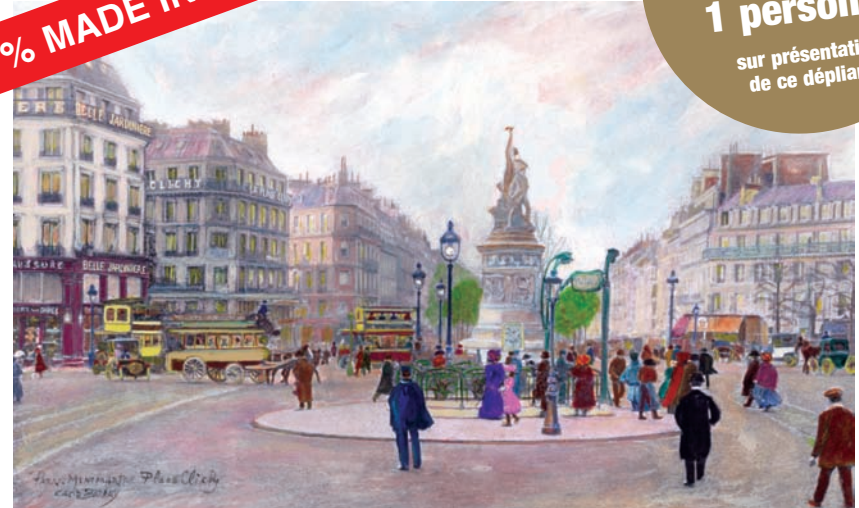
Paris, Montmartre, Place Clichy vers 1900